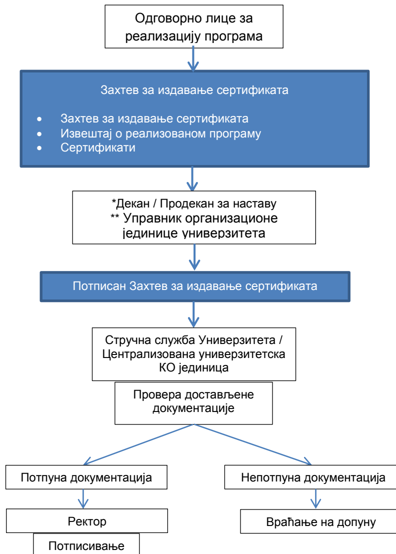
Слика 2: Шематски приказ процедуре за извештавање и издавање сертификата